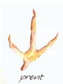
Poot afdruk (prent)